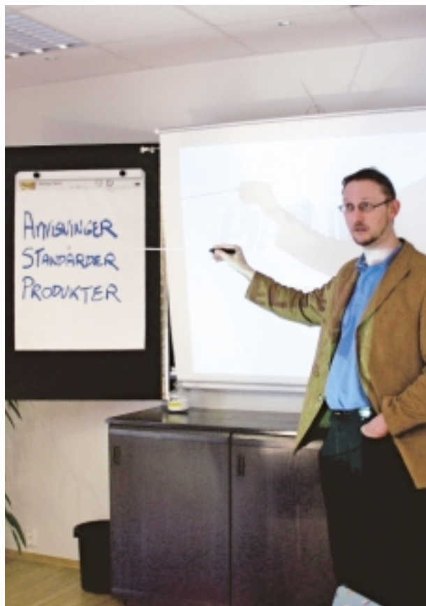
Pipelife bruker mye tid på opplæring og oppdatering av kunder og fagmiljøet.

For Pipelife Norge er det nære samarbeidet med grossister og entreprenører over hele landet en forutsetning.