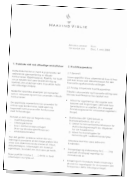
Dette dokumentet er til stor hjelp i utarbeidelsen av anbudsdokumenter. Det gjør at alle hensyn blir ivarettatt, og at alle anbud er direkte sammenlignbare.