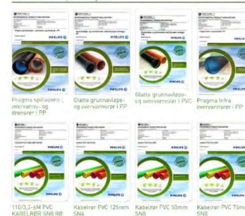
Andre EPDer fra Pipelife Norge AS

Vi har valgt ut fire bærekraftsmål og har også mål om å bli karbonnøytral i god tid innen 2050 i tråd med Green Deal